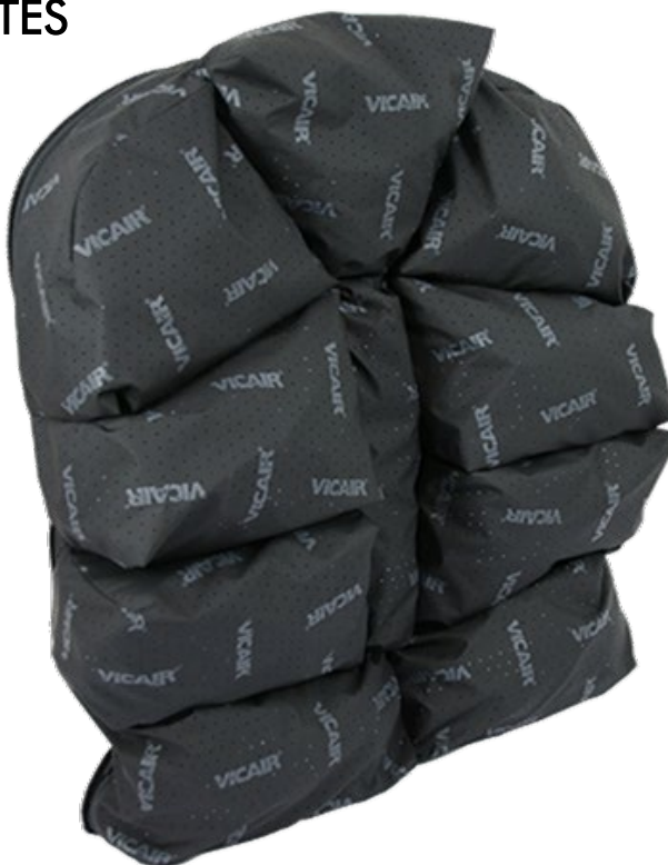
TABLA de PRECIOS / MEDIDAS