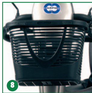
Cesta muy resistente