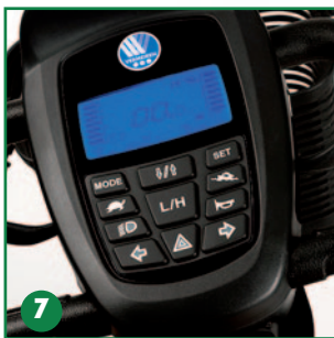
Cuadro de mandos electrónico