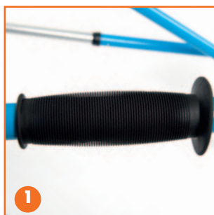
Detalle de la empuñadura