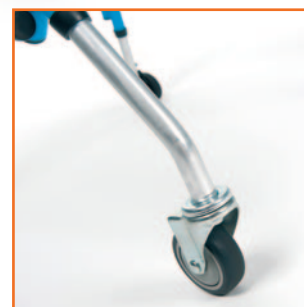
Ruedas direccionales opcionales