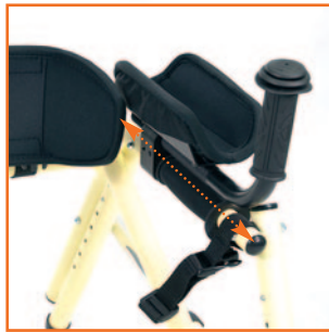
Soporte antebrazo - U93 opcional