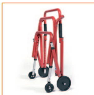
El chasis es totalmente plegable