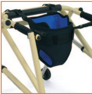
Arnés pélvico - U92 opcional