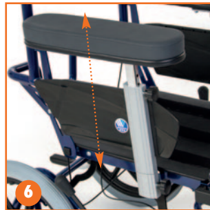
Opcional: Apoyabrazos regulable en altura y profundidad