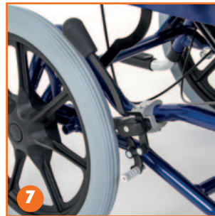
Palancas de freno largas