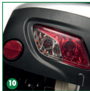
Luces e intermitentes traseros