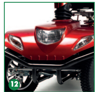
Luces e intermitentes delanteros y parachoques