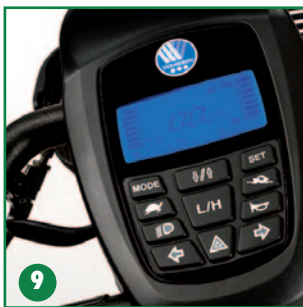
Cuadro de mandos electrónico