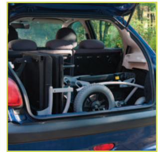
Compacto que incluso cabe en un maletero de un coche pequeño