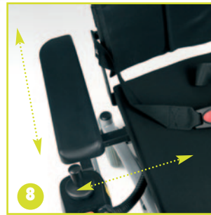
Reposabrazos regulables en altura y anchura