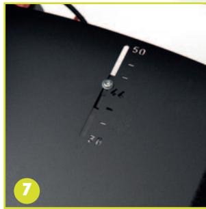
Indicación de profundidad del asiento